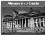
Alemán en primaria