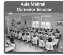
Aula Matinal Comedor Escolar