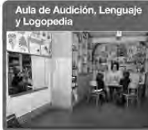
Aula de Audición, Lenguaje y Logopedia