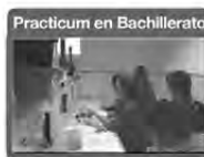
Practicum en Bachillerato