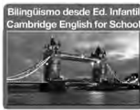
Bilingüismo desde Ed. Infantil Cambridge English for School