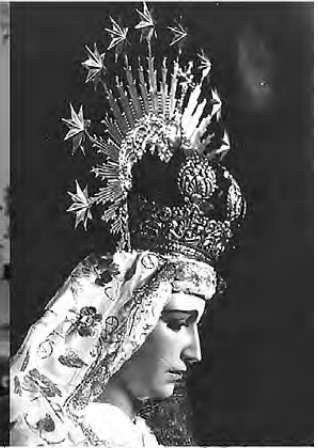
Nuestra Señora del Amparo