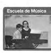
Escuela de Música