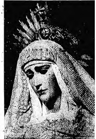
Política Virgen de Ntra. Sra. del Amparo, con Hular de la Cofradía de Nostro Pto. Area de la Paz, del popular barrio de San José, que se celebrará por nuestro Aniversario. Precede el próximo domingo a las 10