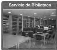
Servicio de Biblioteca